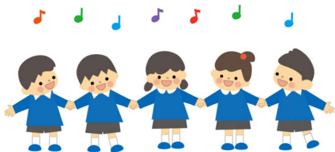
預かり保育推進事業単価表（令和7年度）

幼稚園の教育時間終了後や休業日に「預かり保育」を実施する私立の幼稚園等に特別な助成措置を講じる都道府県に対して、国がその助成額の1/2以内を補助。